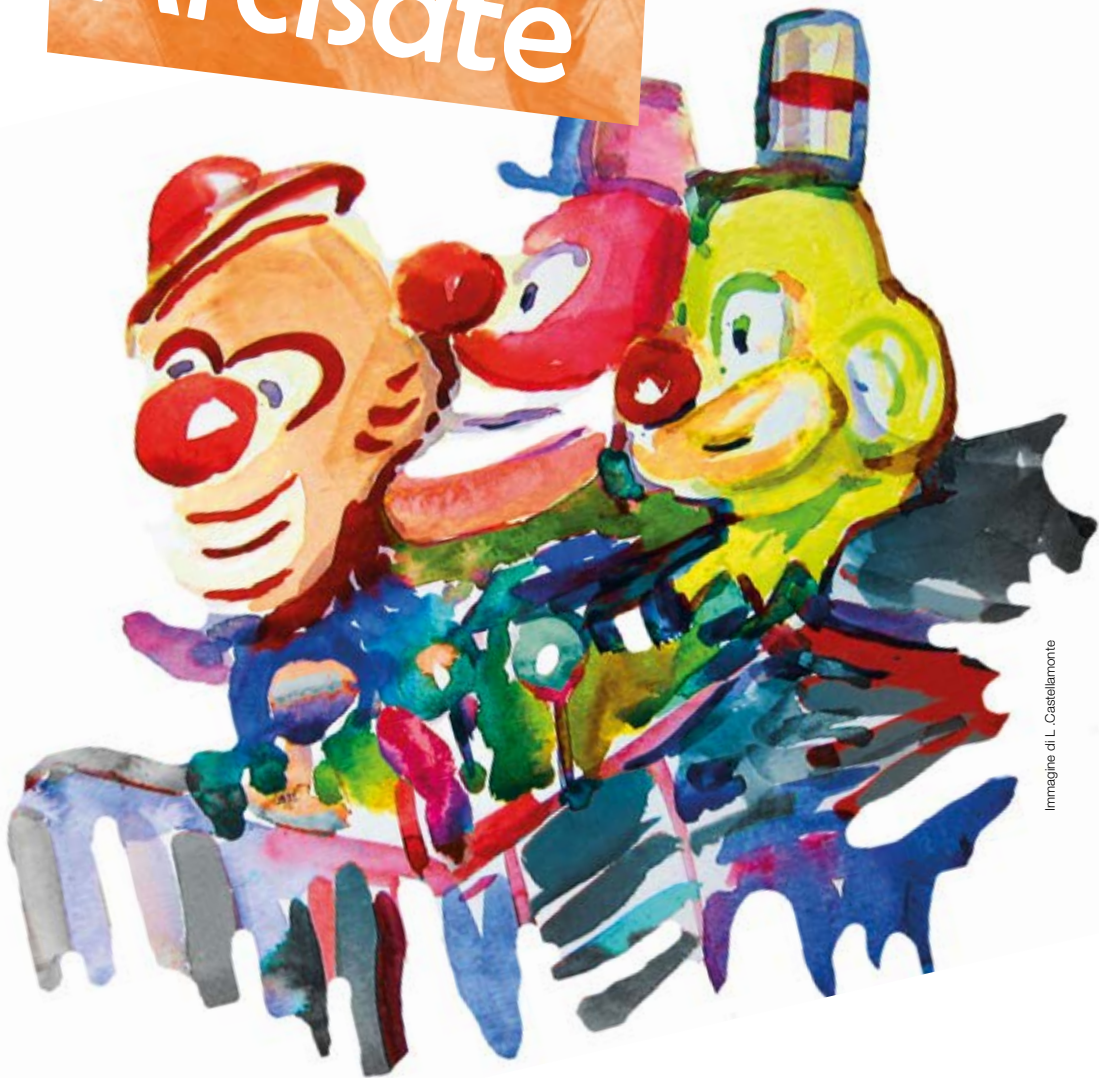
Immagine di L. Castellamonte